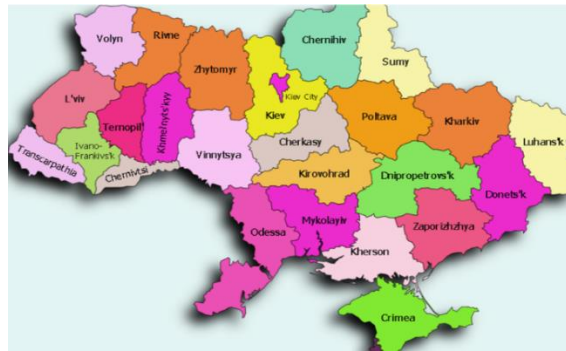
Ukraine for ever