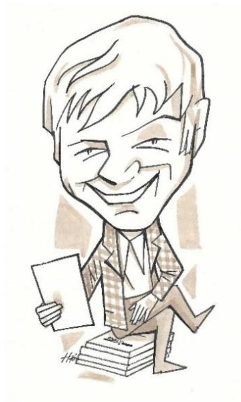
Fecit Stanislav Hlinovsky, CZ, 1972