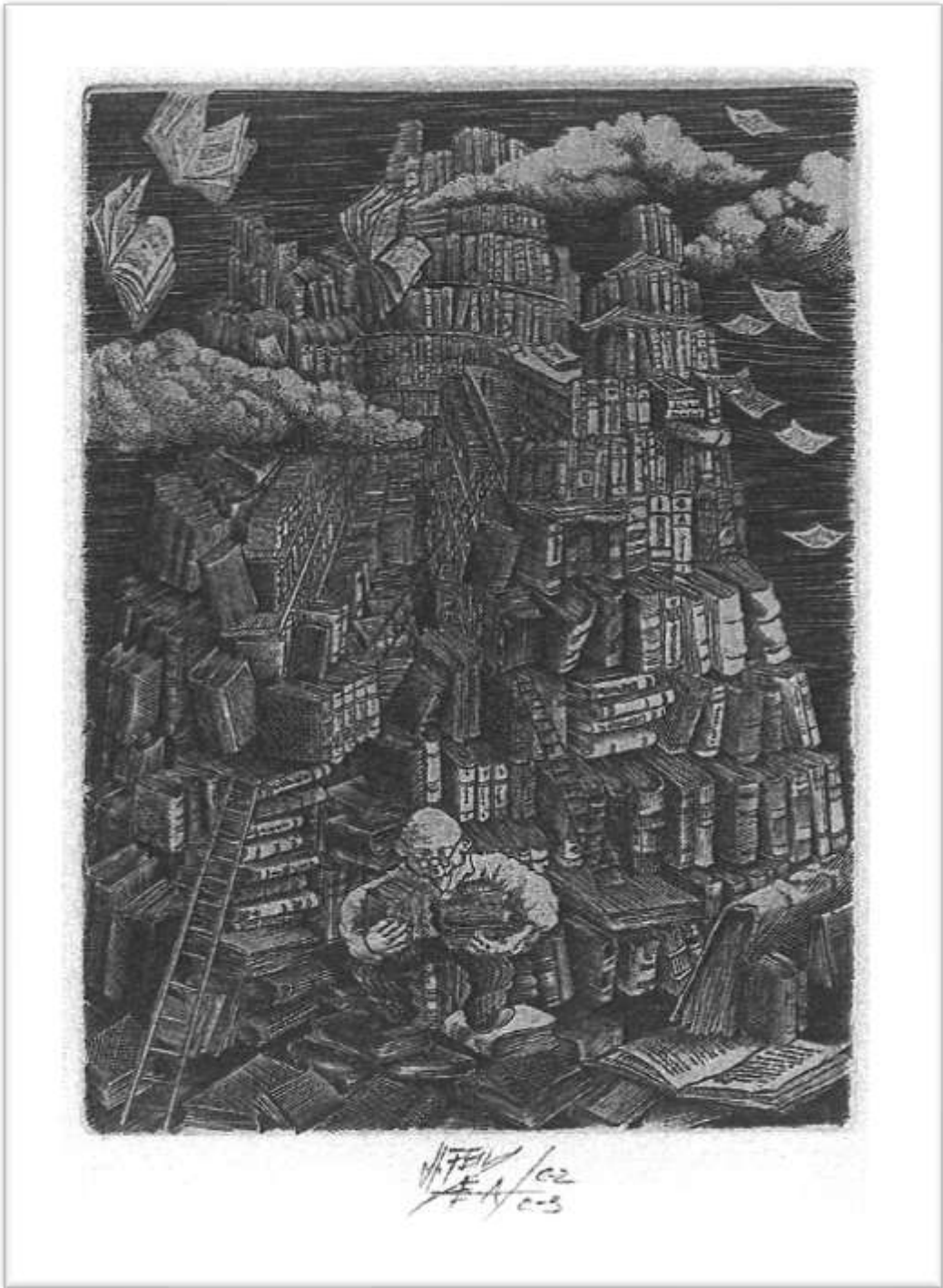
Fecit Henryk Feilhauer 1942 – 1999