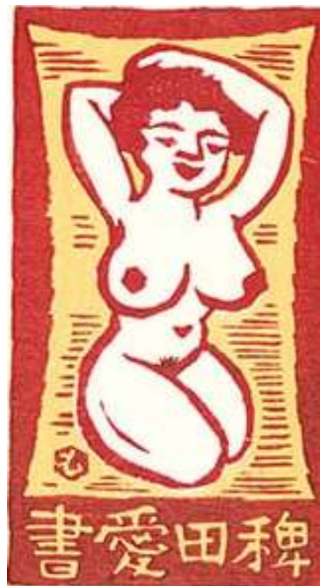
Doshun contributed engravings to the six “Ichimoku-shū” (“First Thursday Society Collections”) of the “Ichimoku-kay” (“The First Thursday Society”), all in bright colours. In 1949 he also designed the cover of the fifth collection.