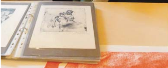
Auf der Jahrestagung der Deutschen Exlibris-Gesellschaft e.V. in Haltern im Oktober 2021