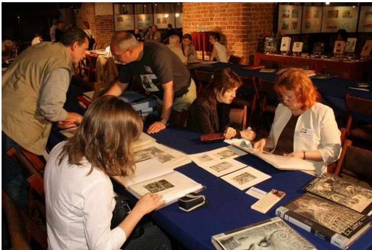
Exchange Malbork Castle

Zur Erinnerungt: Informationsblatt zum 15. Internationalen Jamboree der Exlibris-Künstler und -Sammler. Ihr Wunsch, an der Biennale teilzunehmen, sollte bis zum 19. Mai 2023 an die folgende E-Mail-Adresse geschickt werden: a.krupa@zamek.malbork.pl