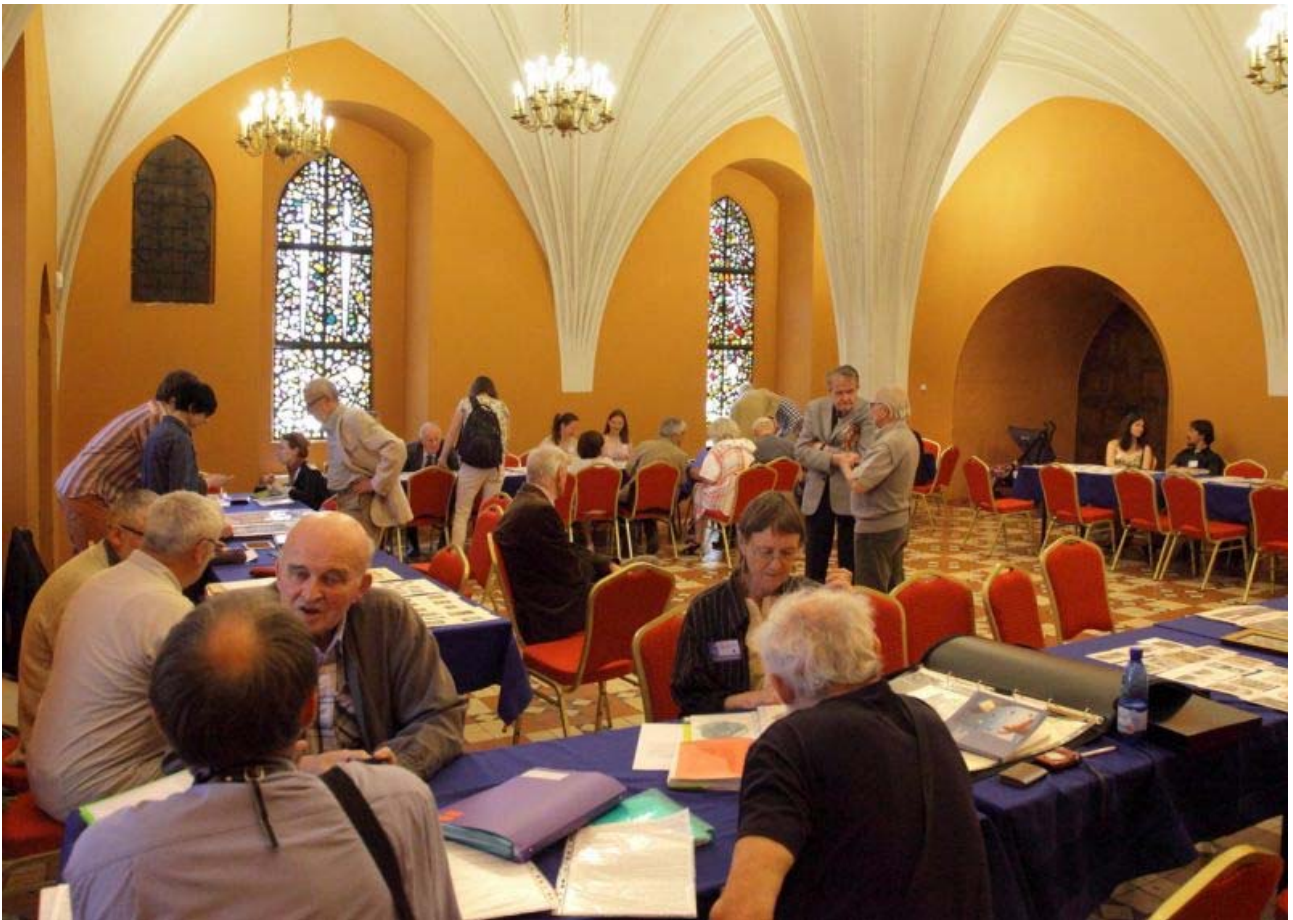
Exchange Malbork Castle

提醒您： 第十五届国际出书艺术家和收藏家联谊会信息表。您参加双年展的愿望应在2023年5月19日前发送到以下电子邮件地址： a.krupa@zamek.malbork.pl