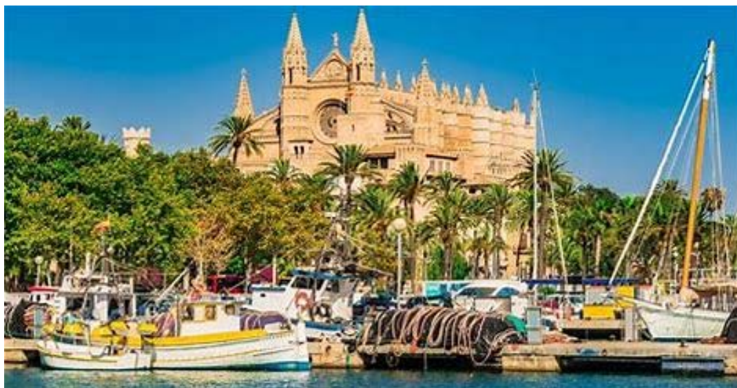
Palma de Mallorca