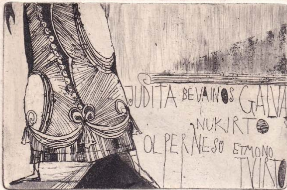
1/ Retai Žirgulytei labai debažo ir fonda. Elavon. Mikšys